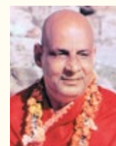
Swami Sivananda (1887 – 1963)

Uno dei grandi santi dei nostri tempi, questo grande e rinomato saggio è l'ispiratore dei Centri Sivananda Yoga Vedanta in tutto il mondo. L'essenza del suo insegnamento, espressa in oltre 300 libri, è "Servi, Ama, Dà, Purificati, Medita, Realizza".